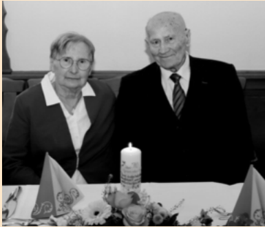
Eßleben, im Februar 2025

Anzeige online buchen: anzeigen.wittich.de