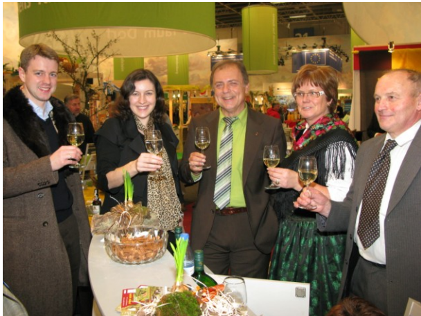
MdB Dorothee Bär mit Gatten besuchte unseren Stand, Landrat und die Bürgermeister